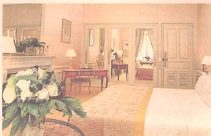
Habitación en el Hotel Lancaster de París.