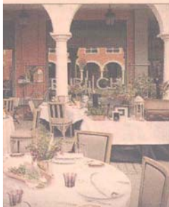
la izquierda, La Biguine Loung (Madrid); arriba, la terraza de Enrich, en La Moraleja; la derecha, imagen de la terraza de Visit p, en el Hotel Pulitzer (Barcelona).

● Abac. Avda. del Tibidabo, 1 (Barcelona, Tel.: 93 319 66 00). Xavier Pellicer continúa su línea impecable que le ha valido este año su segunda estrella Michelin. Técnica, platos equilibrados y actuales que rezuman contemporaneidad, pero no reniegan de la tradición. En su carta de verano, foie gras al vapor de bambú, jarrete de ternera lacado o conguitos helados con yogur ácido. Carta: 90 euros, menú degustación, 125 euros (ambos, sin vinos).