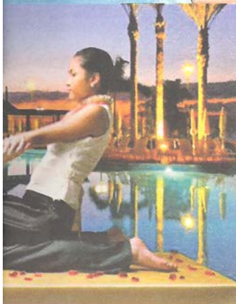
las instalaciones de Val de Neu, en la estación de Spa de Picos, en Cantabria, y el hotel Iberostar la Adeje (Tenerife)